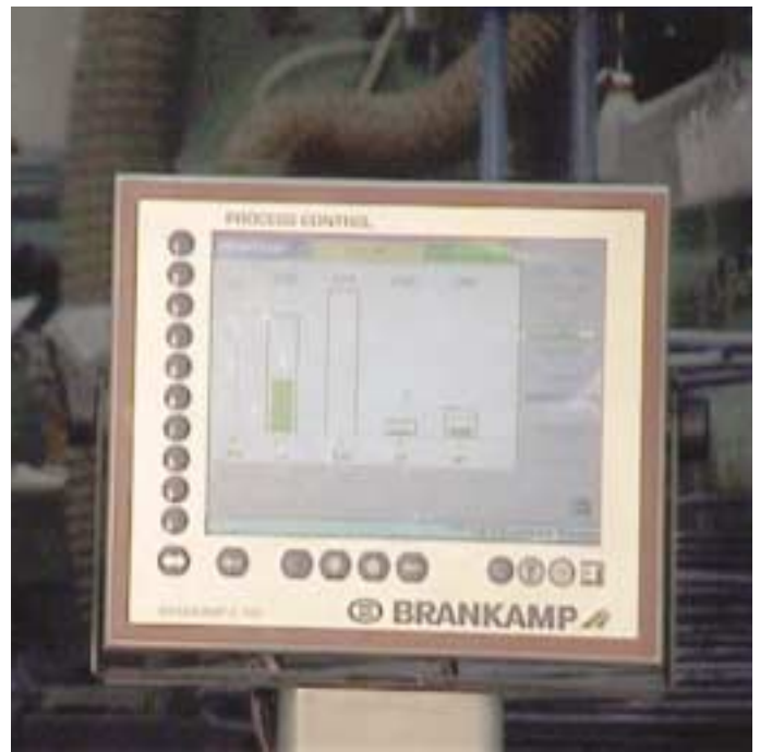
Die Vernetzung der Maschinen in den Werkhallen