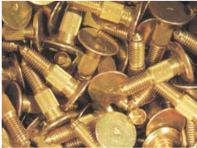
Produktpalette Schrauben

"Technologisch ist das alles heute kein Problem mehr", meint auch Walter Staehlin, Leiter des Customer Supports der Heidelberger Druckmaschinen AG. Daten der Maschinen können per Internet abgefragt und Fehler diagnostiziert werden. Aus Sicherheitsgründen habe man auf die Fernsteuerung jedoch verzichtet: "Nicht auszudenken, was passiert, wenn wir eine Druck-