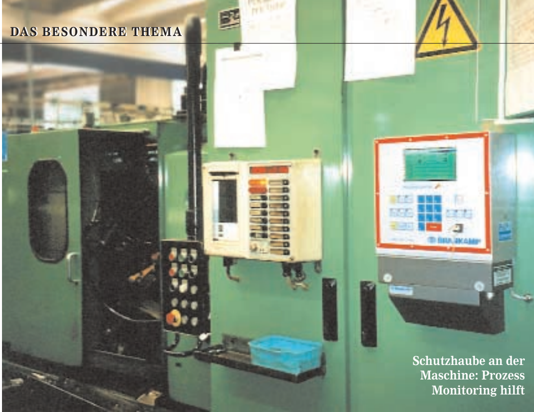
Schutzhaube an der Maschine: Prozess Monitoring hilft