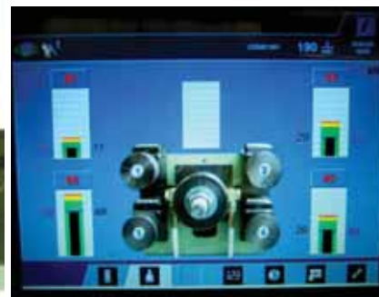
Anzeige der absoluten Walzkräfte in kN

System ermöglicht durch klare Handlungsanweisungen die Einrichtphase schneller und wesentlich effizienter durchzuführen. Gleichzeitig wird die Standzeit der Gewindewalzbacken erhöht und die Maschinenbelastung verringert.