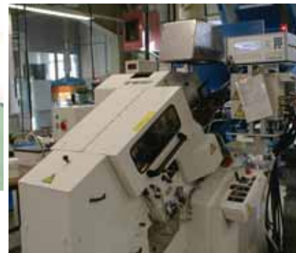
Gewindewalze von E.W. MENN