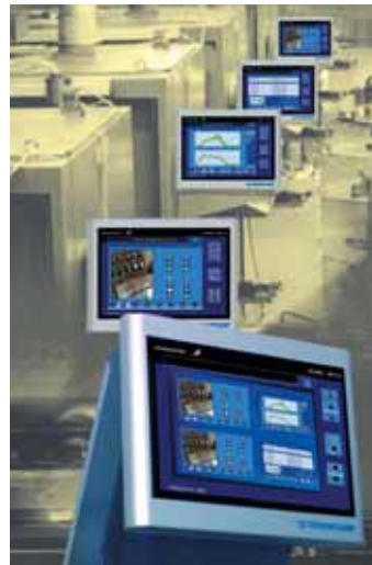
Vernetzte Produktion: BRANKAMP FactoryNet