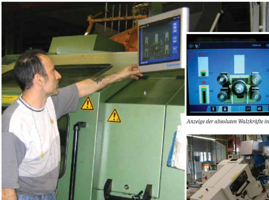
BRANKAMP PK 6000 im Einsatz

Ziel der Zusammenarbeit war es, dem Werker für die Einricht- und Produktionsphase verlässliche, aussagekräftige und leicht verständliche Informationen über den Gewindewalzprozess zu liefern. Das BRANKAMP ProcessMonitoring-